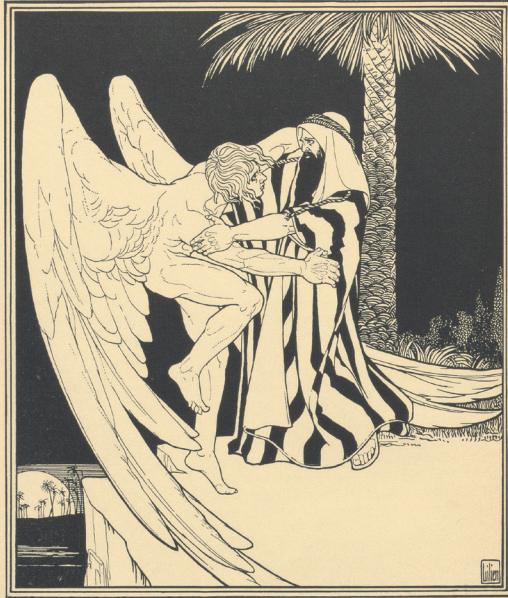
Lilien, Ephraim Moses: Die Bücher der Bibel, 1908