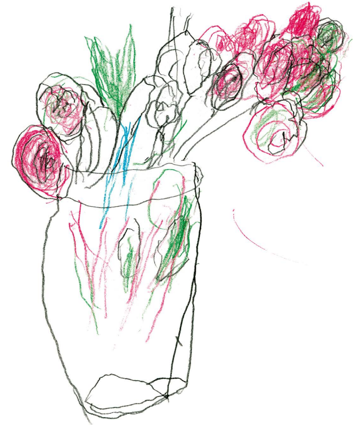
Ida Rodenacker, 2007, Bleistift und Buntstift, 20×30 cm

Rechts: Eberhard Warns, 2005, Acryl auf Leinwand, 140×100 cm