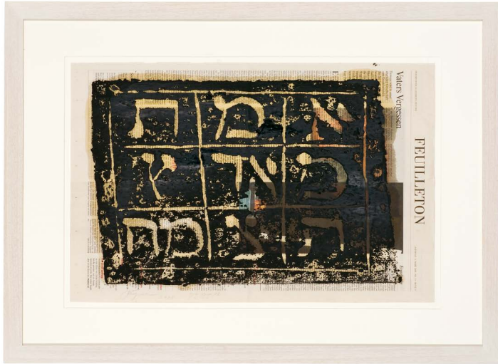
Felix Droese, 2008, Holzdrucke auf Zeitungspapier, 70×50 cm